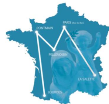
Les apparitions mariales...