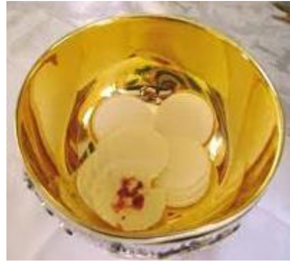
Les miracles eucharistiques